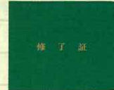
修了証ケース(濃緑・梨地) No.744 定価 242円

●サイズ：H78×W103mm ●材質：ビニール ●PP袋入/インク付着防止加工 ●内ポケット×2枚+ビニールポケット×1枚付