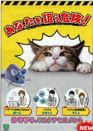
狙う危険・リスク No.740 定価 297円