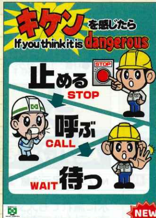
キケン・止める呼ぶ待つ No.741 定価 297円