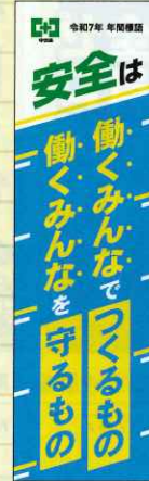
令和7年 年間標語 No.738 定価 2,860円