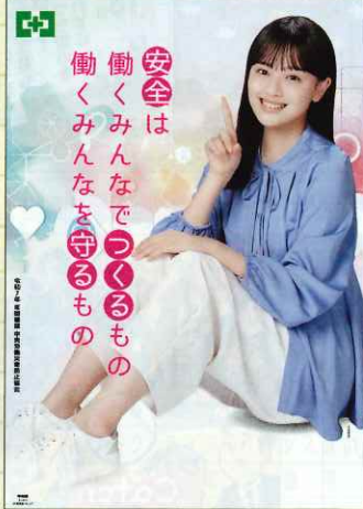
令和7年 年間標語(タレント) No.736 定価 396円