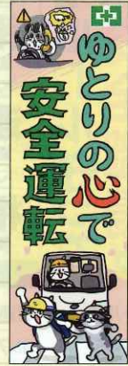
安全運転・仕事猫 No.739 定価 2,970円